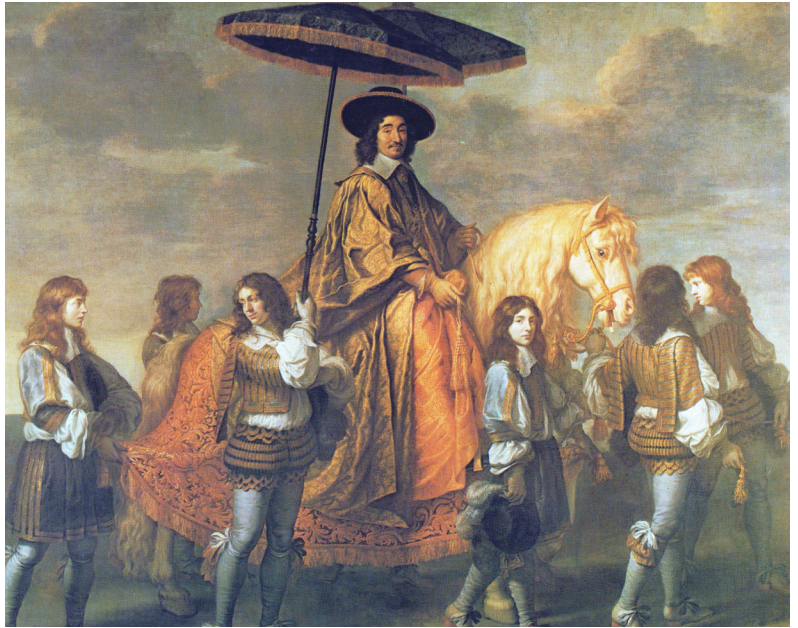
Charles Le Brun, 'Kansler Séquier' (1661). Olie på lærred, 295 x 351 cm.

Kunsthvet får i Kunstneren Charles Le Brun (1619–1690) sin lovgiver, i akademierne sine domstole, i kongen og finansminister Colbert sine beskyttere. Klassicismens kunstlære tilretter sig tidsalderens livs- og kulturformer, ligesom det merkantilistiske økonomiske system, efter enevældens målsætninger.