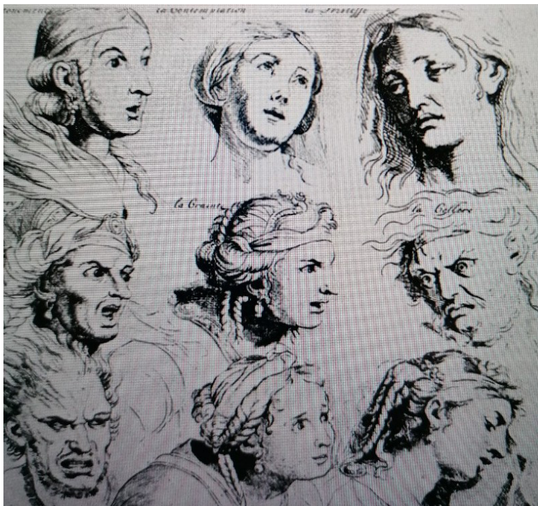
Charles Le Brun, tegninger som viser hvordan mennesker føler.

Hyacinthe Rigaud, 'Louis XIV' (1710). Olie på lærred, 277 x 194 cm. Læg mærke til brugen af hæle og paryk; barokopfindelser der skulle styrke indtrykket af ophøjet magt!