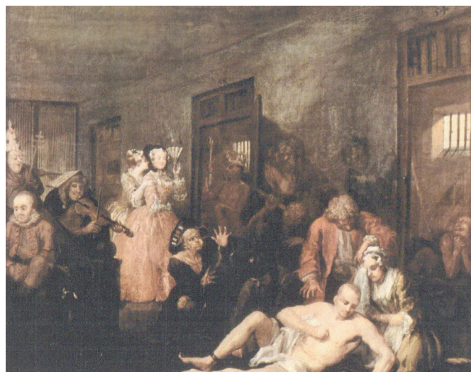
William Hogarth, "The Madhouse" (1733).